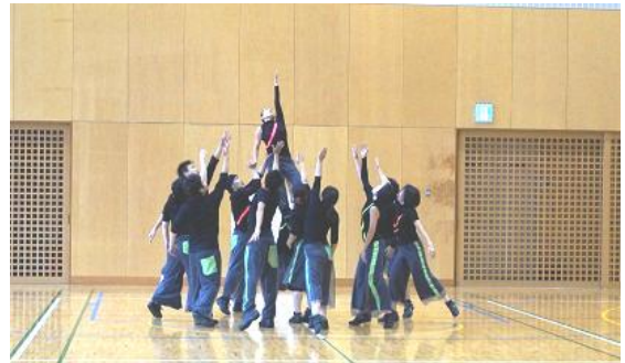
教員作品「LINE～それって本当につながってるの？」

午後には、連盟創立60周年の記念エキシビションとして若手教員による創作ダンス作品、日本体育大学伝統芸能コースの学生さんによるエイサーの演技が披露され、その後5人の講師の先生方から授業の現場で活用できる内容を教えていただき、皆さん熱心に研修されていました。