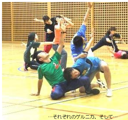
…それぞれのゲルニカ、そして…

今回は、合同でおこなったため大変盛りだくさんで、内容の濃い講習となりました。特に、それぞれの発達段階で、指導のポイントや声掛け、問いかけの内容が違ってくるのが講義や実技を通して理解できました。汗だくになりながらも笑顔があふれ、大変充実した時間になりました。