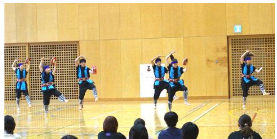
日本体育大学 伝統芸能コース「エイサー」